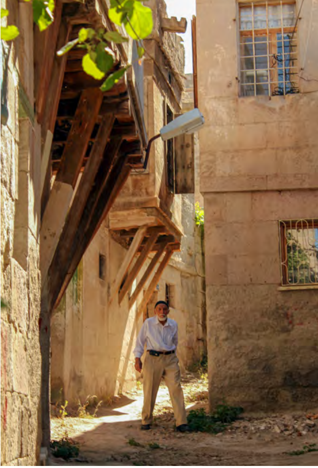
▲ Darsiyak - Kayseri