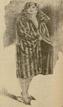
Kadın, gölgeden kurtulmak, güneşe çıkmak, Cumhuriyet devrinde kader böldü.

Bazı giy kavulmuşları görüyor yörenim yanıyor.