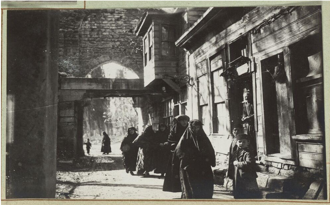
Silivrikapı'da sokakta çarşafli kadınlar, 1919.