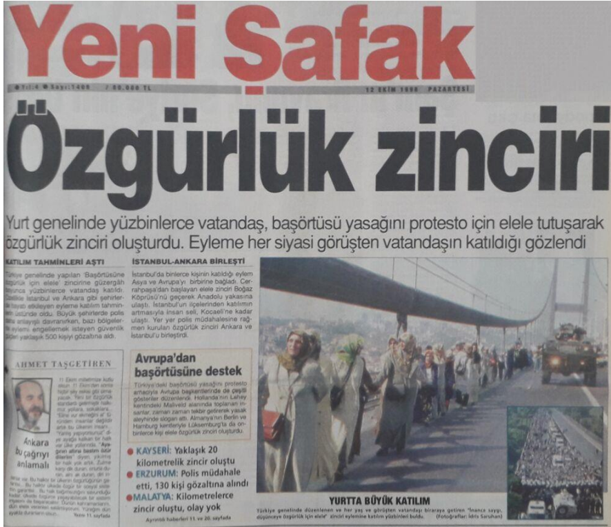
“Elele Eylemi”, 1998. Kaynak: Yeni Şafak no. 1409 (12.11.1998)