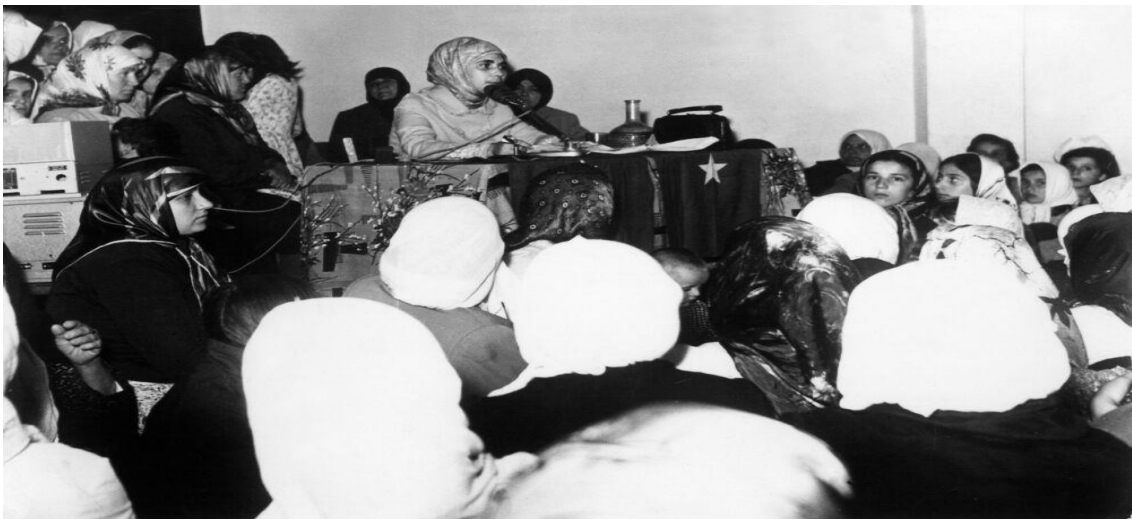
Şule Yüksel Şenler, bir konferans sırasında dinleyicilere hitap ederken, 1967.

Şule Yüksel Şenler (1938-2019), 1960’ların ikinci yarısında gerek yazıları gerekse Anadolu’da verdiği konferanslarla tanıttığı modern ve şık tesettür fikriyle meseleyi Zehra Hakkı’nın bıraktığı yerden ele alır. Şenler’in çabası çeşitli düzeylerdeki devlet yetkililerinin olumsuz tepkileriyle karşılaşır. Dönemin Cumhurbaşkanı Cevdet Sunay’ın, kendisini kastederek “Sokaklardaki kapalı hanımların öncüleri cezalarını göreceklerdir” demesi üzerine Şenler, bir açık mektup yayımlayarak “Cumhurbaşkanı Allah’tan ve milletten özür dilemelidir” der. Açılan dava sonunda verilen 9 ay hapis cezasını Sunay affetse de Şenler, affi reddederek bu süreyi cezaevinde geçirir. Kendisiyle yapılan çeşitli söyleşiler ve sözlü tarih görüşmelerinde başörtüsü örtmeye, modern ve şık başörtüsü modelleri geliştirmeye başladığı 1965 yılından itibaren evinin, kızlarını başlarını örtmeye ikna etmek isteyen aileler ve ailelerini başlarını örtmeye ikna etmek isteyen kızlar için bir uğrak olduğunu belirtir. 1 Onun tasarımını yaptığı ve bugün de yaygın olarak kullanılan başörtüsü modeli de “Şule başı” ya da “sıkma baş” şeklinde anılır.