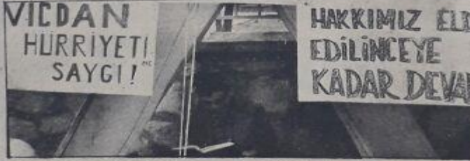
MUSTAFA DEMİRİÖZ, PROTİSTO ORUCU TUTTUĞU ÇADIRINDA