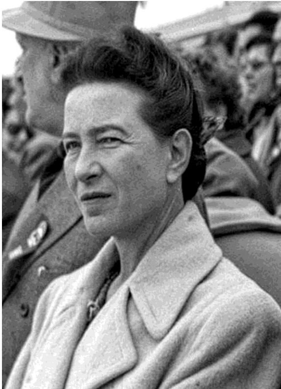
“Kadın doğulmaz, kadın olunur.” Ünlü Fransız felsefeci ve Yazar Simone de Beauvoir’ın bu sözü aslında gender teorilerinin de temel teziydi.

Gender teorisi karşıtlarının ifadesiyle gender ideolojisinin sosyal bilimlerde popüler hâle gelmesiye onu toplumsal cinsiyet şeklinde ilk olarak kullanan John Money sayesinde oldu.