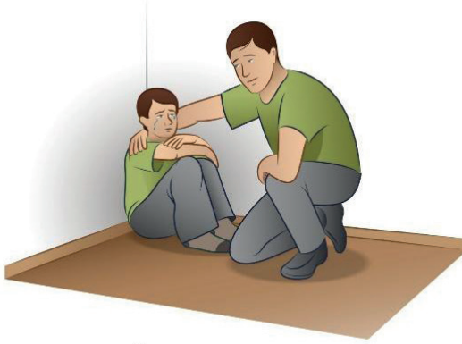
Şek. 5 Öz-Şefkati hissetmek ve ifade etmek

8. Danışan daha önceki travma belleğini tanımladıktan sonra, bilinçli öz şefkat kullanarak onu çözmeye başlayın. Bu noktada terapist, hâlâ üçüncü şahıs gözlemci durumunda olan danışandan, kendi içindeki genç benliğine karşı şefkat duygularına erişmesini ister (Şekil 5):