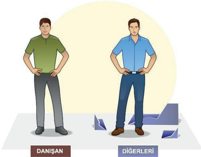
Şek. 6 Aktive edici olayı tekrar ele almak ve yeniden değerlendirmek.

Bu noktada danışan büyük olasılıkla fantezideki diğer kişinin gerçekçi olmayan idealleştirme duygusunu ve cinsel arzuya sahip olduğu için kendisinden duyduğu utancı kaybetmiş ve cinsel duygu ve davranışlarının arkasındaki gerçek motivasyonlar hakkında fikir sahibi olmuştur. Kendisini ve diğer kişiyi eşit olarak deneyimlemesi muhtemeldir ve esas cinsel fanteziyi/anıyı duygusal anlamda düzensiz olarak deneyimleme olasılığı daha düşüktür (Şekil 6).