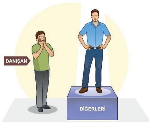
Şek. 1 Aktive edici olayın incelenmesi.

Terapist şu soruyu sorar: “Bana üzerinde çalışmak istediğiniz cinsel fantezi veya deneyimden bahsedin. Bana vermek istediğiniz kadarını ayrıntılı olarak anlatın.”