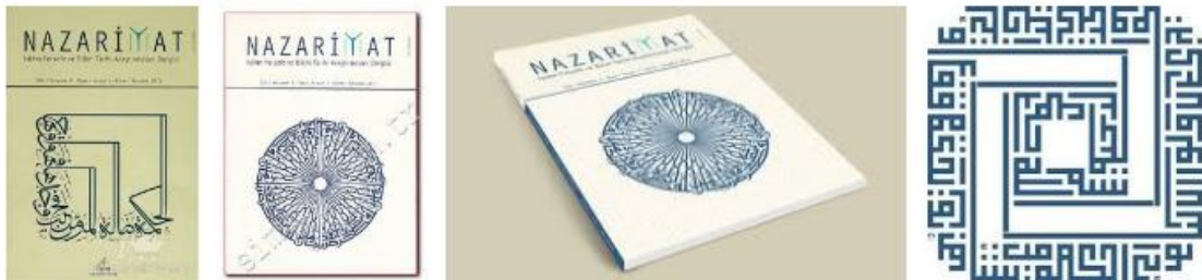
Nazariyat: İslam Felsefe ve Bilim Tarihi Araştırmaları Dergisi

Nazariyât da bu balın depolandığı ve sunulduğu arı kovani olarak görülebilir. Tarihî tecrübe bu yolculuğun anahtar terimlerinden biridir. Belki yine Bacon'a atıf yapabiliriz: "Tarih, nehir gibidir; hafif olanları sürükler; ağır olanları dibine çeker. Tarihin ağırlıkları ancak dibe dalarak çıkartılabilir." İşte Nazariyât, bu ağırlıkları çıkartmak için dibe dalma etkinliğinin dostlarla birlikte yapıldığı bir vasatın adıdır.