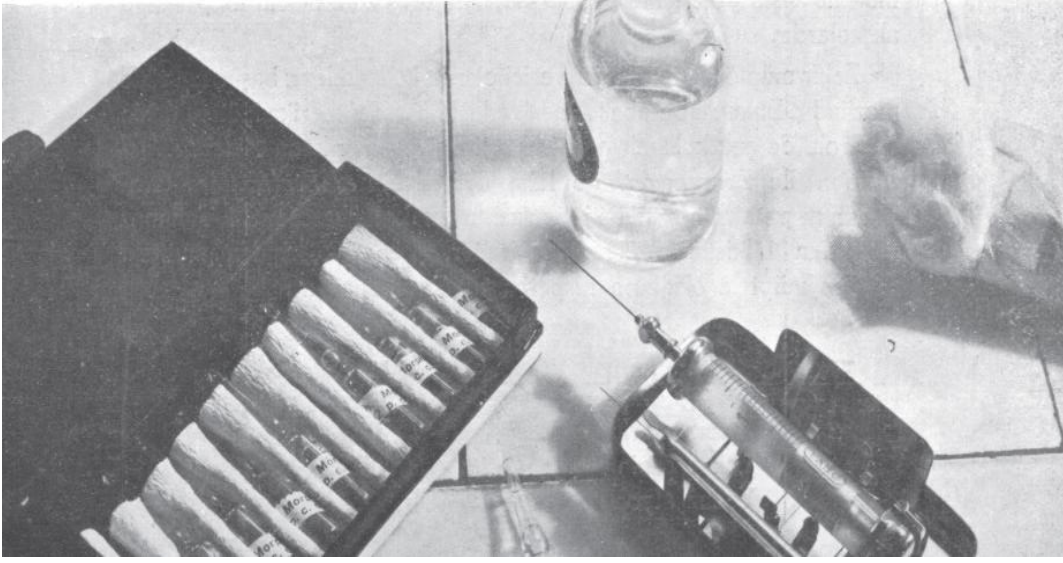
Morfin enjeksiyonlarında kullanılan Pravaz şiringası ve morfin ampulleri

Daha çok burundan çekilerek ya da sigara tütününe karıştırılarak kullanılan eroin hızla bir bağımlılar topluluğu yarattı. Ancak bu ilk başta pek fark edilemedi.