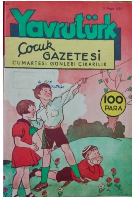
Resim 1. Yavrutürk 'ün ilk sayısı (2 Mayıs 1936)

Yavrutürk dergisi Cumhuriyetin ideolojileri, Türklük ve militarizmi birlikte harmanlayarak “ Yavrutürk çocuğu” diğer bir deyişle “Cumhuriyet çocuğu” yaratmaya çalışmıştır. Bu çabaları dergide yer alan çizgi roman ve hikayelerde net bir biçimde görülür. Çocuklara Yavrutürk numarası dağıtarak başlattıkları “ Yavrutürk sayımı” ( Yavrutürk , 15 Mayıs 1936, s.218) ve bu sayımın ardından Türkiye’nin en çok Yavrutürk okuyan sınıfını bulmak için yapılan okuma yarışı ile bir “ Yavrutürk sınıfı” seçilmesi söz konusu çabaların başka bir örneğidir.