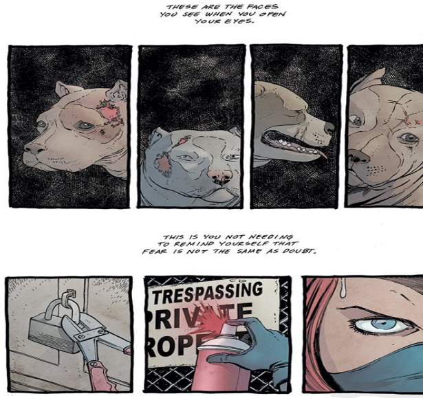
Şekil 2. Salvation of Innocents çizgi romanından bir sayfa 5 .