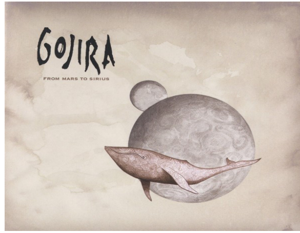
Şekil 4. Gojira – From Mars To Sirius (2005) albüm kapağı 7 .

Bilim adamlarına göre, balinalar, oldukça gelişmiş varlıklar. Ancak zekâlarını ne için kullandıklarını bilmiyoruz. Biz insanlar olarak, daha iyi yönetmek, evler inşa etmek, birbirimize hükmetmek gibi şeyler için zekâmızı kullanıyoruz ve balinalar bizim yaptığımız bu şeylerin hiçbirini yapmıyorlar. Öyleyse onların faaliyetleri nelerdir? Bazı teoriler, balinaların beyin aktivitelerinin balina toplumlarında daha fazla uyum sağlamak ile ilgili olduğunu savunuyor. Onların davranışlarının insanın çok ötesinde olduğunu düşünüyorum. Onlardan öğreneceğimiz çok şey var ve bu şarkıyı onlara atfetmek istedik. İnsanın dünyasında günden güne katlediliyorlar ve ayrıca daha fazla katledilmelerine izin veren yasalar da mevcut (Duplantier, 2005).