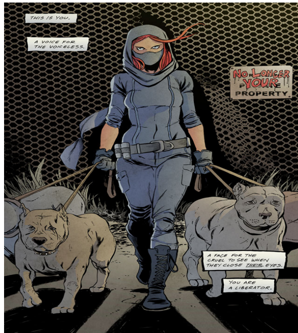
Şekil 3. Salvation of Innocents çizgi romanından bir sayfa 6 .

Gojira da 2005 yılında piyasaya sürdüğü From Mars to Sirius (Mars'tan Sirius'a) albümünde, küresel ısınma gibi çevresel konuların tartışmasını içeren bir tür distopya kurgulamış ve albüm kapağı, şarkı adları ve sözleri yoluyla bu distopya yansıtılmıştır. Bu albüm ve albümde yer alan Flying Whales (Uçan Balinalar) adlı şarkı için grup üyelerinden Joe Duplantier bir röportajda şunları söylemiştir: