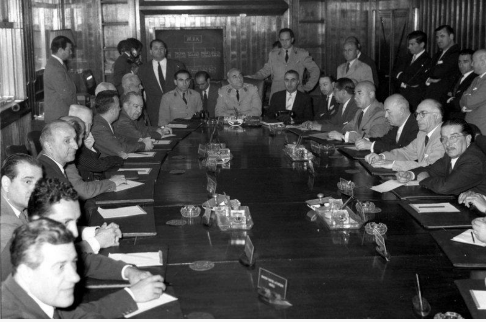
Milli Birlik Komitesi

Eline gazeteyi aldığıında 147'likler listesinde kendi ismini de gördü. Darbenin memlekette estirdiği jurnalcilik havasını şöyle yorumlayacaktı: