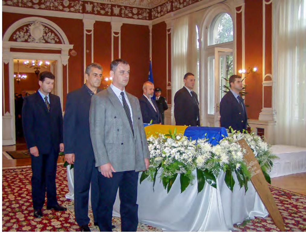
▲ Aliya İzzetbegoviç’in cenaze töreni