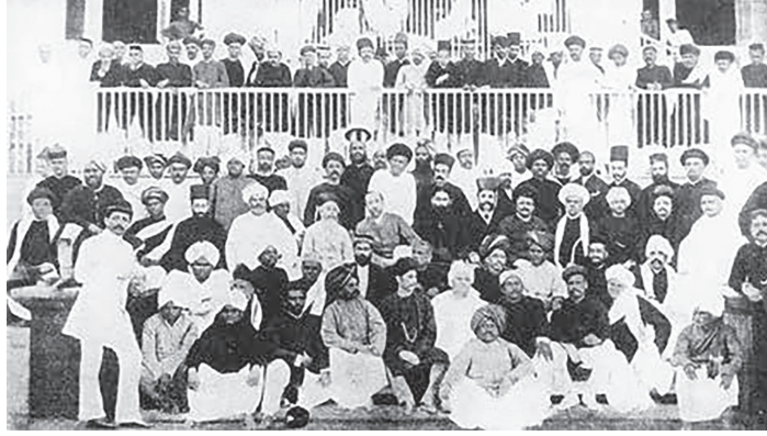
1. Hindistan Ulusal Kongresi 1885

olmadan İngilizlerin himayesinde yaşayan son Babür Hükümdarını kendilerine lider seçiyorlar mesele. Mahatma Gandhi'nin kendisi bile 1910'lara gelene kadar Hindistan'daki İngiliz yönetiminin tamamen gitmesini değil, İngiliz idaresi altında eşit haklar için mücadele edilmesini savunuyor. Bir noktada, özellikle Birinci Dünya Savaşı'ndan sonra, bu imparatorluklar bize eşit ve onurlu haklar vermeyecek, onun için bunlardan kurtulup bağımsız olmaktan başka çaremiz yok tezi ortaya çıkıyor. Dolayısıyla, ben Sultan Abdülhamid antiemperyalist değil derken, herkes antiemperyalist idi ama sadece o öyle biri değildi, demek istemiyorum. İlk başlarda Cemaleddin Af-gani, Muhammed Abduh ve Reşit Rıza da İngiliz imparatorluğu konusunda çok net keskin reddiyeci vizyona sahip değil, sürekli eleştirirler bile.