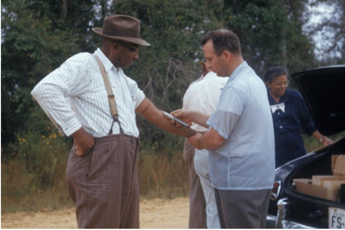
Tuskegee Frengi Çalışmasının bir parçası olarak kan örneği alınması

Bizi haftada üç kez kan laboratuvarına götürüp kollarımızı bağlayıp kan alırlardı. Benim sol kolumdan o kadar çok kan alırlardı ki bazen bayılırdım. Bir insanın ölmeden ne kadar kan kaybedebileceğini anlamak istiyorlardı. Aynı sırada sağ koluma da iğne yaparlardı. O iğneler dayanılmayacak kadar kötüydü.