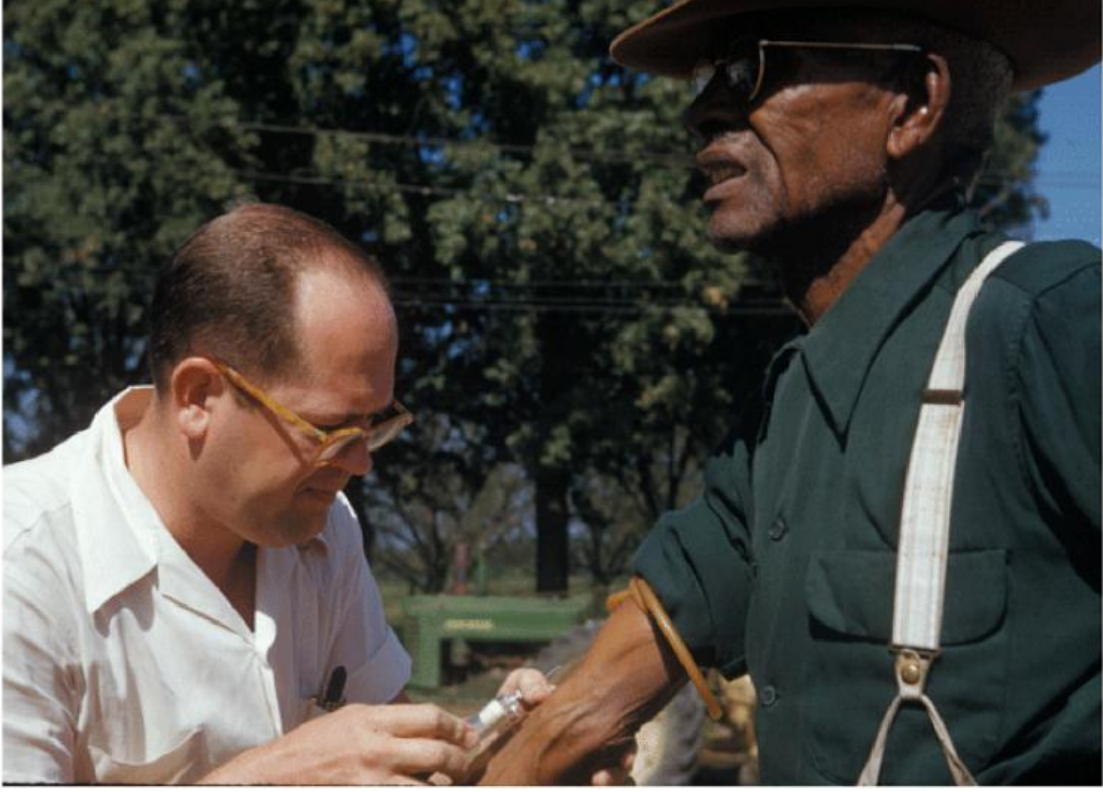
Tuskegee Frengi Çalışmasının bir parçası olarak kan örneği alınması

Tıp bilimi, ne yazık ki, tarihi boyunca ırkçı eğilimler tarafından en fazla istismar edilen bilim sahalarından birisidir.