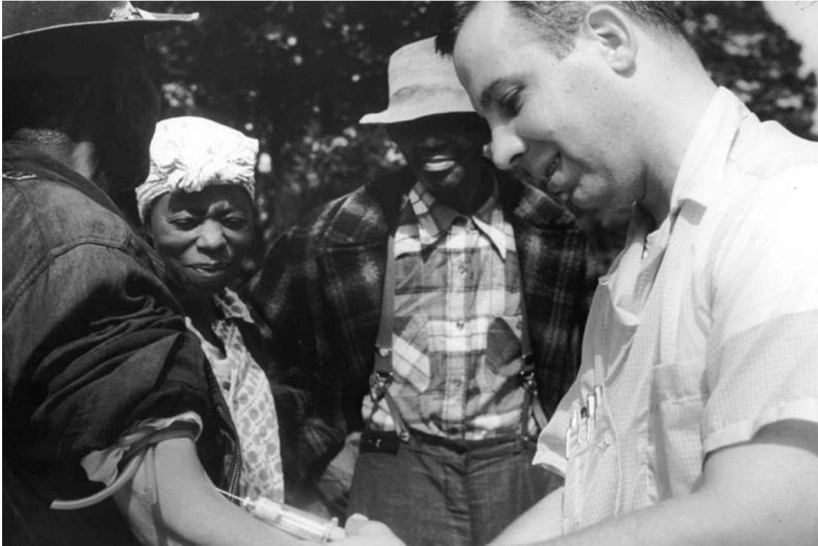
Tuskegee frengi çalışmasının bir parçası olarak bir hastadan kan alan doktor

Araştırmanın muhtemel amaçlarından birisi de siyahi erkeklerin cinsel güç/isteklerini gözlemlemek ve toplumda siyahilerin gerektiği zaman nüfuslarını azaltmanın yolunu bulmaktı.