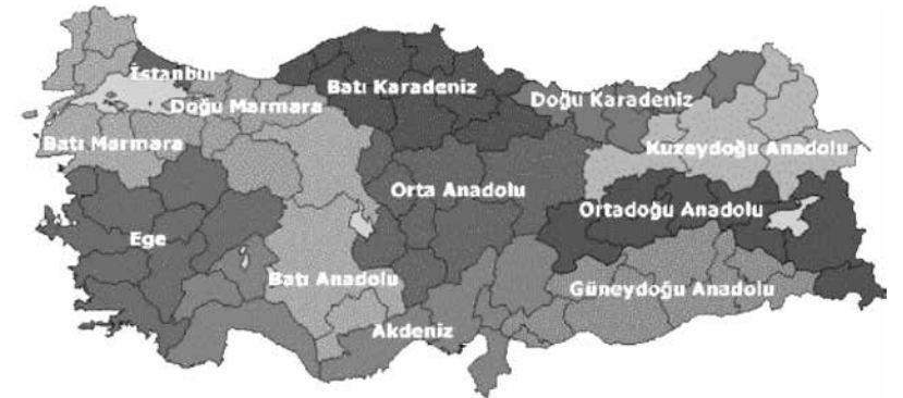
Şekil 1: Araştırma Bölgeleri

Araştırmanın veri toplama aşaması 2013 yılı Ocak-Nisan aylarında gerçekleştirilmiştir. Anket, araştırmanın evrenini temsilen seçilen 81 şehirde ve demografik ölçekle kent kategorisine dâhil edilebilecek ilçeler dâhil 179 kentsel, 173 kırsal olmak üzere toplam 352 yerleşim biriminde 5541 kişiye uygulanmıştır . Araştırmaya katılanların bazı özellikleri (Tablo1-Tablo 10)'da gösterilmiştir.